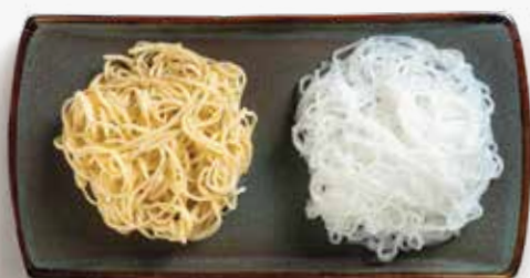
Fideo de tamago

Disfruta el ramen con la pasta que más te guste.