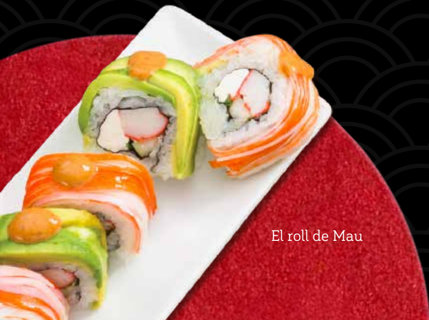
El roll de Mau

Queso crema, aguacate y kakiage por dentro, salmón fresco por fuera; servido con salsa chipotle y cebollín. $12.79