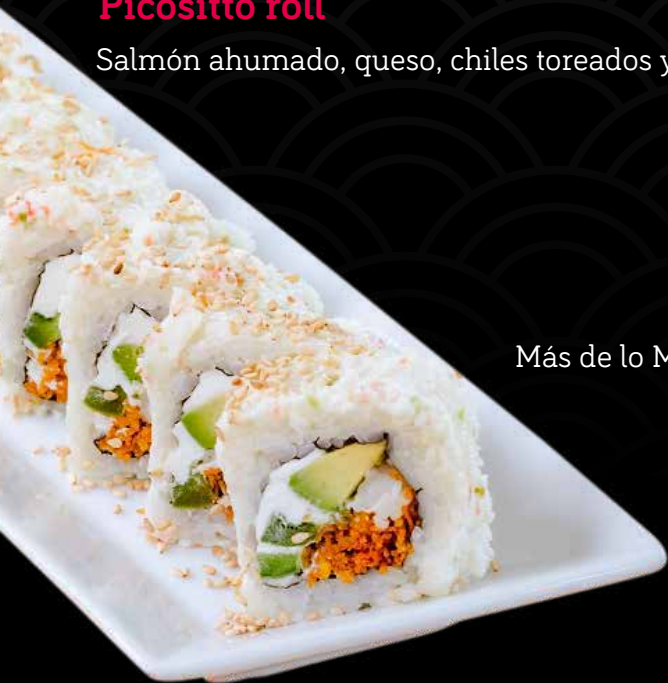
Más de lo Mismo

Salmón ahumado, queso, chiles toreados y masago. $11.25