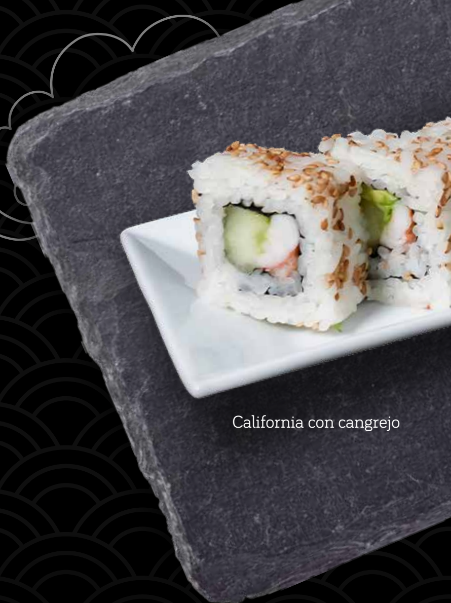
California con cangrejo

Salmón ahumado y queso crema por dentro; masago y ajonjolí por fuera. $10.50